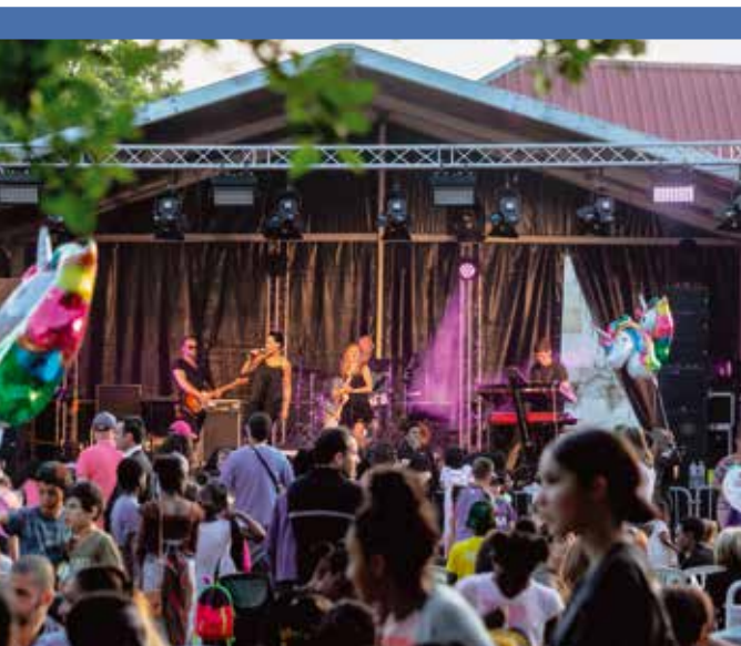
La danse et la musique avaient une place importante au cours de la fête pour faire battre les cœurs à l'unisson et nous emporter dans un tourbillon onirique.