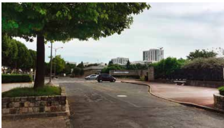
Le parvis du cimetière intercommunal.

Le parvis du cimetière intercommunal est aujourd'hui dans un état dégradé. Une réflexion à son sujet, à laquelle les Chevillais sont invités à participer, est engagée.