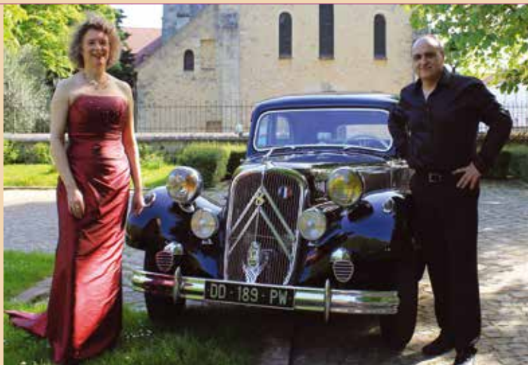
En voiture pour un tour de chant lyrique avec le duo Helric.

• Médiathèque Boris Vian 25, avenue Roosevelt (01 45 60 19 90) • Conservatoire place Jean-Paul Sartre (01 56 70 42 45)