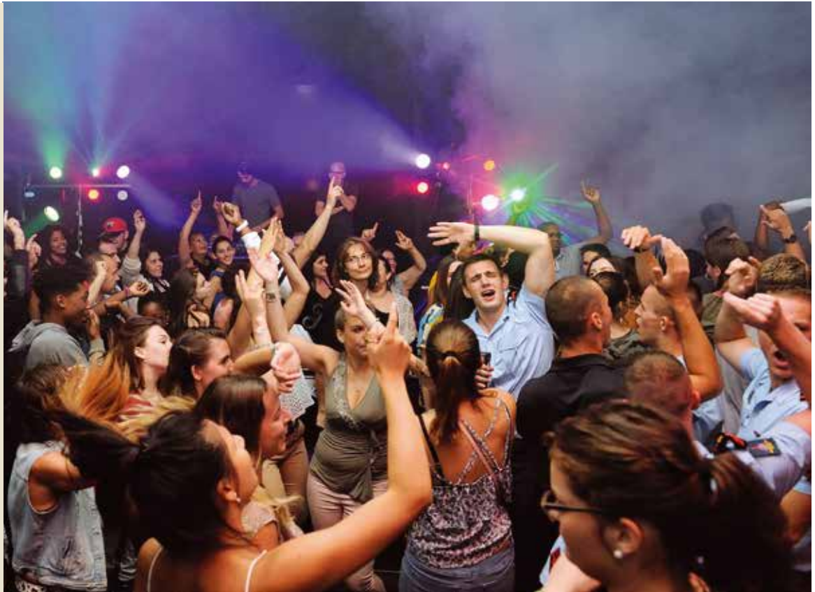
Le 13 juillet, venez enflammer le dancefloor lors du bal des pompiers.

À l'occasion de la fête nationale, les sapeurs-pompiers organisent leur traditionnel bal le 13 juillet dans la caserne située au 382, avenue de Stalingrad (sur la RD7 en face du centre commercial Belle Épine). Vous êtes attendus nombreux à partir de 20h pour vous déhancher jusqu'au bout de la nuit sur la musique sélectionnée par un DJ. La soirée s'annonce festive avec des jeux et des surprises, et l'ambiance est garantie. Les sapeurs-pompiers figurent également parmi les partenaires des Planches et seront présents sur l'événement pour des ateliers autour de la prévention et initier le public aux gestes de premiers secours. ✱