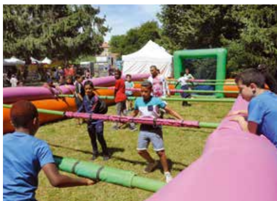
Il était une fois des petits princes dont les pieds magiques faisaient trembler les filets d'un incroyable baby-foot humain.