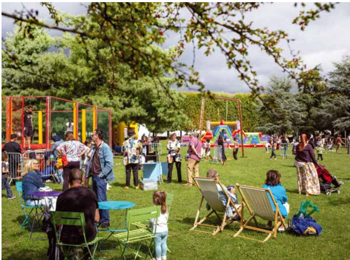
Du 17 juillet au 18 août, les activités foisonnent au parc Petit Le Roy. À l'occasion des Planches, venez vous amuser au grand air en famille ou en entre amis.

104, rue Petit Le Roy et au 01 45 60 04 03.