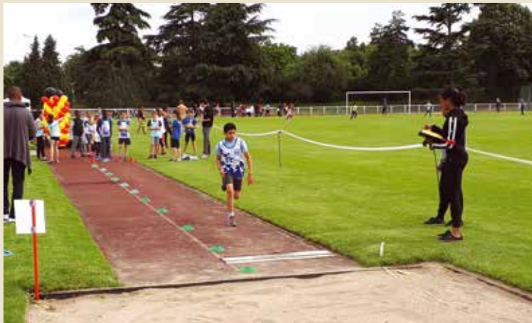
Le saut en longueur, une discipline phare de la compétition d'athlétisme.

Éveils (6-8 ans) et poussins (9-10 ans) de six clubs val-de-marnais avaient rendez-vous au parc des sports dimanche 17 juin pour la dernière compétition de la saison.