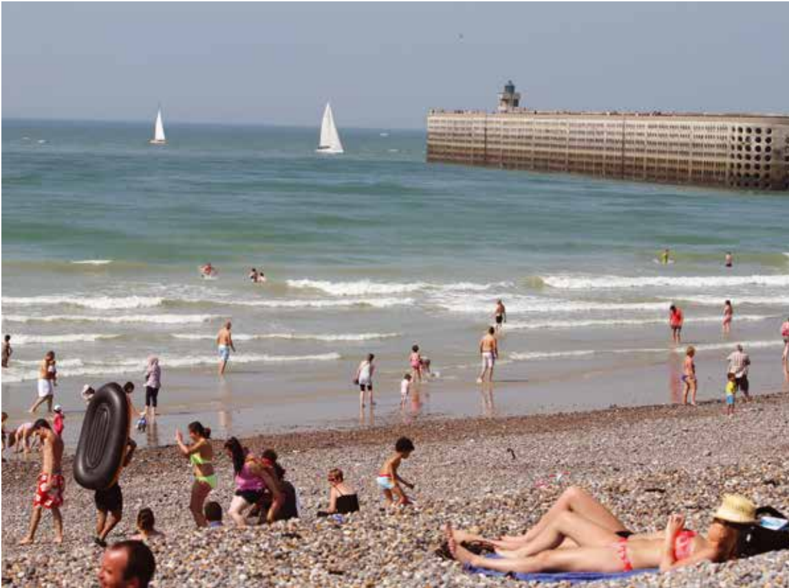
Plage, farniente et baignade sont au programme des Sorties à la mer.