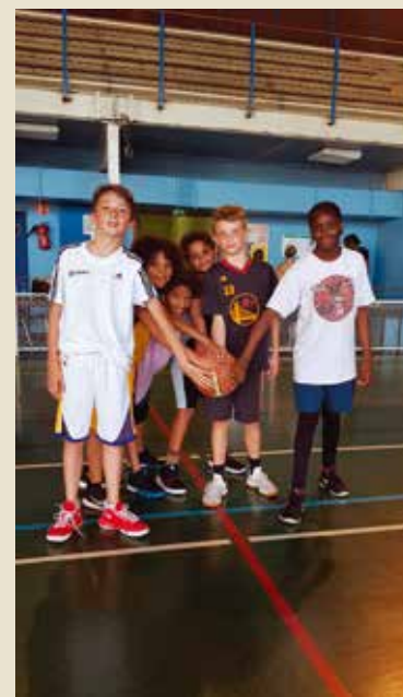
En plus de bons résultats, la section basket affiche aussi une bonne ambiance.