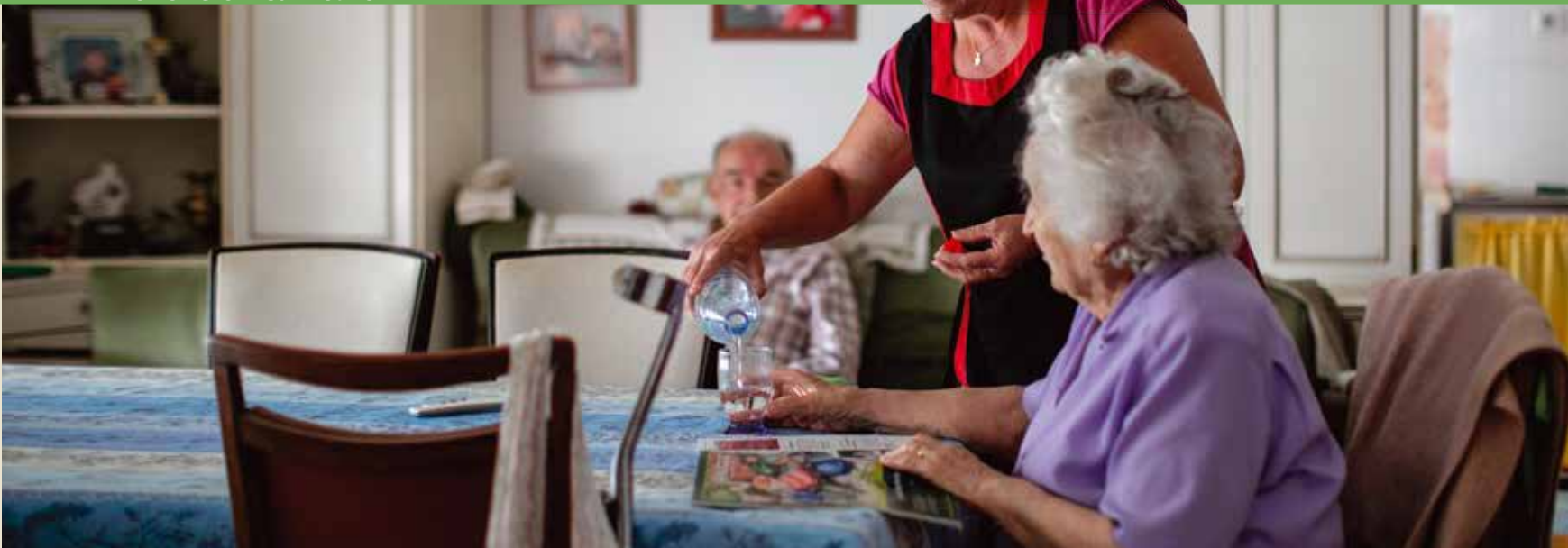
Les aides à domicile s'assurent sur le terrain que les personnes âgées aient les bons gestes en cas de canicule.

Activé depuis le 1 er juin en mode veille, le plan canicule vise à accorder une vigilance particulière aux personnes les plus vulnérables. Durant tout l'été, le secteur Retraités-Santé-Handicap du service Action sociale se mobilise auprès des personnes âgées et handicapées pour leur rappeler les bonnes pratiques en cas de chaleur excessive.