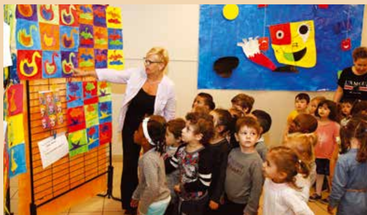
La petite section de la maternelle Pasteur en visite à l'exposition.

Les écoles maternelles ont participé à un prix littéraire. Les enfants ont exposé du 12 au 14 juin les travaux qu'ils ont réalisés dans l'année autour de leur œuvre préférée.