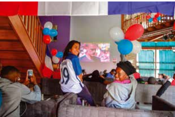
Au SMJ, supportrices et supporters sont derrière l'équipe de France.