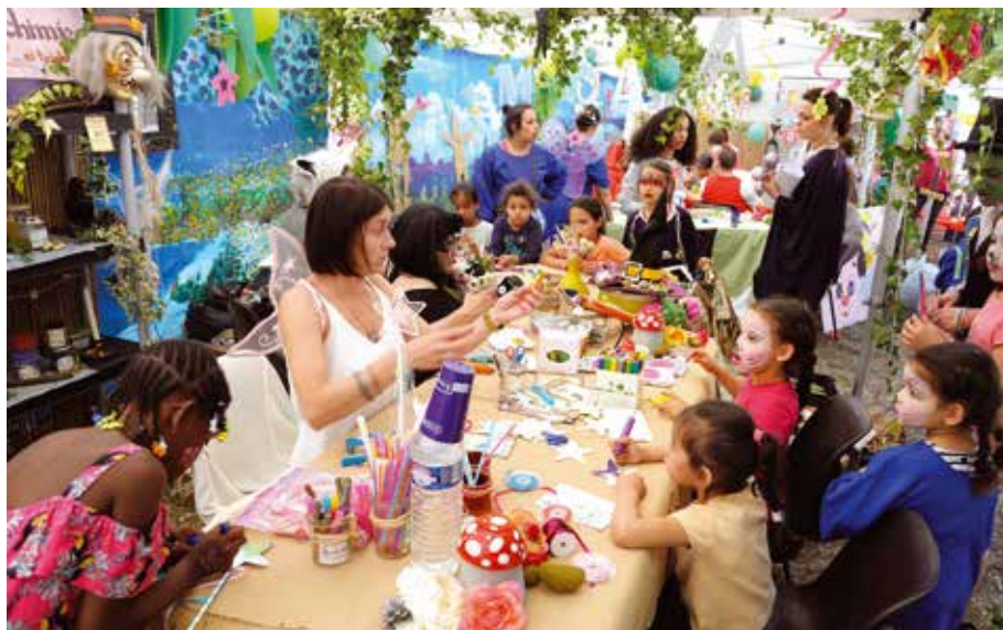
De nombreux stands et animations offraient des moments d'évasion vers des contrées imaginaires où les enfants pouvaient jouer, dessiner et s'amuser en toute tranquillité.