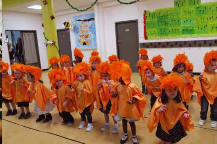
Les enfants de la petite section de la maternelle Pasteur sont tout à leur chorégraphie.