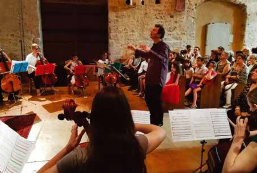
Les jeunes solistes du conservatoire ont montré tous leurs talents lors du concert de fin d'année le 10 juin.