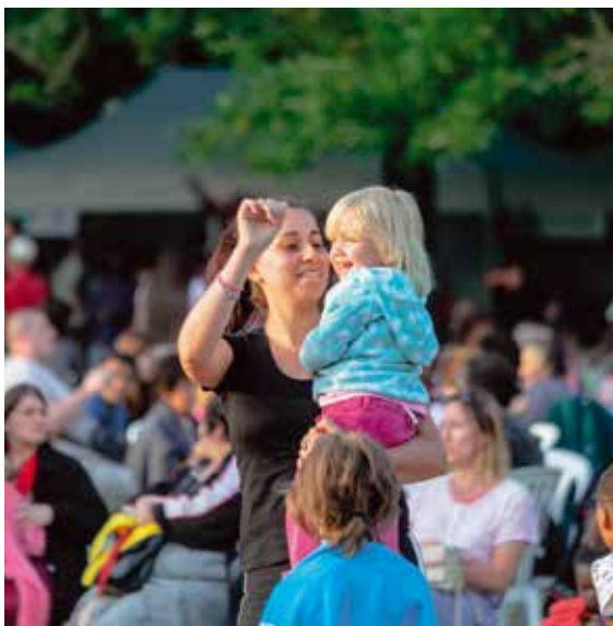
Les uns dansent, les autres savourent l'instant. Le bonheur d'être en famille ou entre amis à la fête communale !