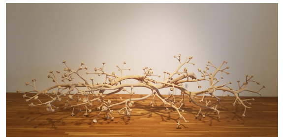
Mue ( la rafle-grappe de raisin)

La question du temps rejoint sa méditation des formes et des matières : une radicalité dans ses œuvres qui nous parle des ciels sombres de la nature. Pour l'exposition, Marie Denis propose un nouvel ensemble de pièces, comme si chaque exposition était la première. L'enjeu est aussi que l'archipel d'artistes et d'œuvres réunis s'entrechoquent, se nourrissent, et inventent un univers inédit qui interroge le merveilleux.