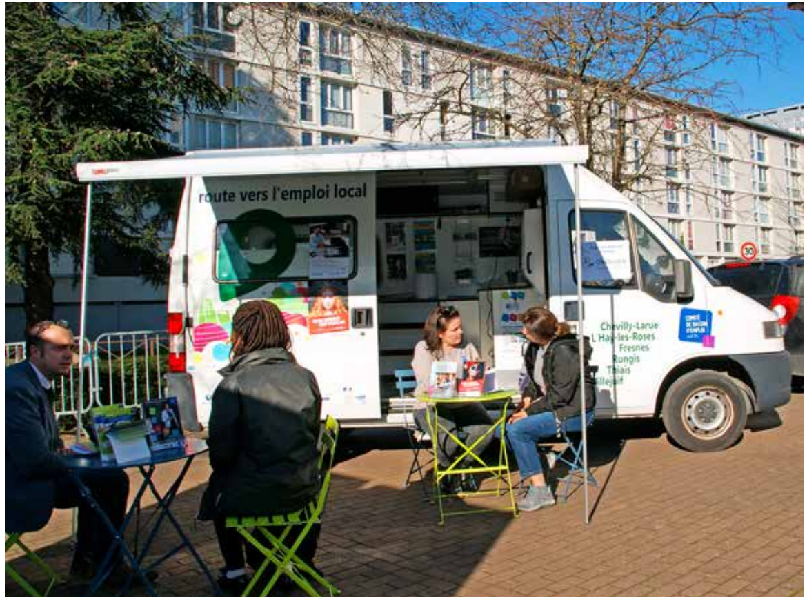
Le job truck du CBE sud 94 passe régulièrement par Chevilly-Larue pour informer les habitants sur les dispositifs de formation et d'accompagnement vers l'insertion professionnelle (photo prise avant le confinement).

Lors du Conseil municipal du 2 juillet, les élus ont voté à l'unanimité l'attribution d'une subvention exceptionnelle suite à la crise de la Covid-19 en faveur du CCAS (Centre communal d'action sociale). Cette aide sera ensuite reversée à des centaines de familles chevillaises afin de limiter les effets de cette catastrophe sanitaire et économique. Elle prendra la forme de bons alimentaires et vestimentaires, distribués courant décembre, à l'attention des foyers des quotients familiaux 1 à 3 et aux familles monoparentales au quotient 4. Les Chevillais avaient jusqu'à la fin du mois d'octobre pour faire calculer leur quotient. La municipalité a également apporté un soutien direct au tissu commercial en exonérant des droits de voirie et des droits de place le marché forain pour l'année 2020. Elle a aussi entrepris des démarches auprès des bailleurs pour étaler les loyers et les charges et invite les Chevillais à soutenir les commerces locaux. Pour aider les TPE et les PME, la Région et la Banque des Territoires ont lancé le fonds Résilience Île-de-France avec l'appui des collectivités dont le territoire Grand-Orly Seine Bièvre. L'objectif est de favoriser la reprise d'activité de ces entreprises grâce à des prêts à taux 0.