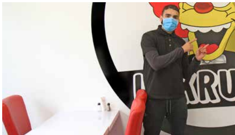
Bienvenue au Krusty.