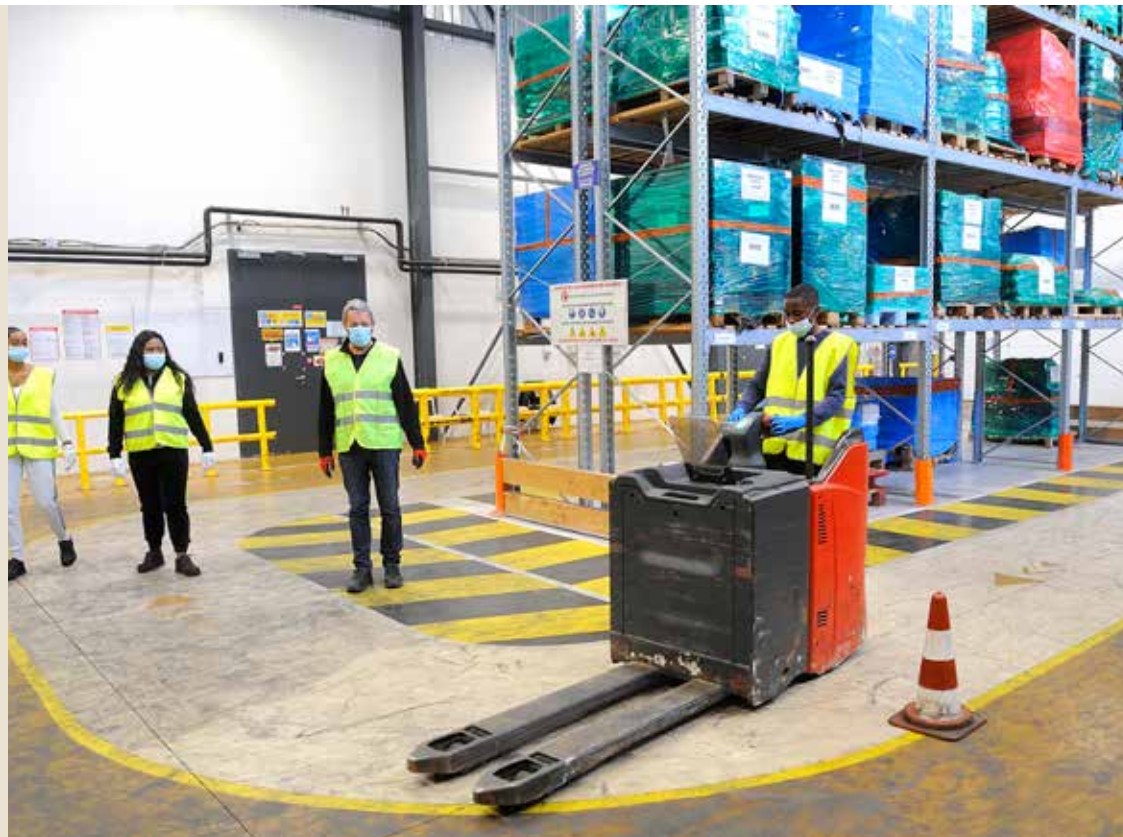
Grâce à un entrepôt situé dans l'enceinte de l'établissement, les élèves de la filière logistique du lycée Pauline Roland sont mis dans les meilleures conditions pour préparer leur entrée dans le monde du travail.

Avec des résultats supérieurs à la moyenne nationale à la dernière session du bac, le lycée Pauline Roland peut tirer un bilan positif du confinement. L'établissement a mis tous les moyens en œuvre pour faciliter l'enseignement à distance et très peu d'élèves ont « décroché » pendant la période. Les élèves de la filière logistique ont pu réaliser les heures de conduite de chariot élévateur nécessaires à l'obtention de leur diplôme et les élèves des filières générales et professionnelles ont bénéficié de séances de soutien si besoin. Depuis la rentrée les Bac pro et Cap en recherche de stages, obligatoires dans le cadre de leur cursus, sont accompagnés par le lycée dans leurs démarches et la période prévue pour ces stages pourrait être élargie. ✱