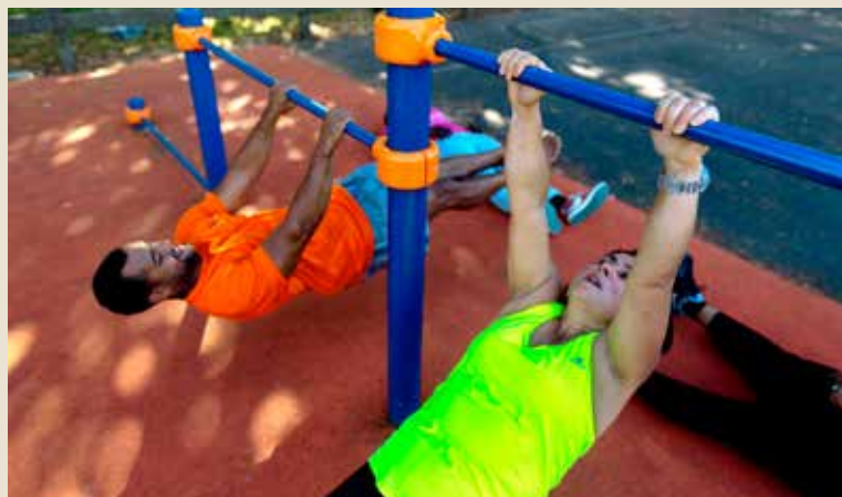
Des agrès de street workout bientôt dans la ville ...

C' EST UN PROJET qui mobilise la Municipalité à travers le service des Sports et le service Jeunesse. Il prévoit l'installation d'appareils en plein air permettant de faire du sport et de la musculation. Barres de traction et autres équipements devraient ainsi trouver place, plusieurs sites d'implantation ayant déjà été répertoriés. Pour mener à bien ce projet, la commune a mis en place une concertation avec les futurs usagers, notamment les jeunes. « La démarche associe les services municipaux mais aussi la Maison pour tous et