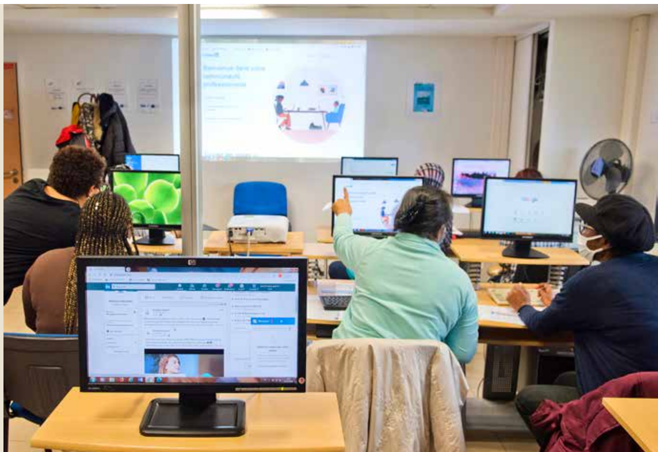
L'association AEF 94 accompagne des centaines de personnes vers l'insertion professionnelle, notamment grâce à des ateliers numériques.

AEF 94 ne se contente pas de proposer un travail aux personnes en réinsertion. L'association les inscrit dans une logique de parcours global avec comme objectif la stabilité et un emploi durable. Elle propose ainsi un accompagnement sur les questions de santé, de justice ou d'accès au logement. Des ateliers linguistiques sont mis en place pour les personnes ne maîtrisant pas le Français. L'insertion professionnelle et sociale est également favorisée grâce à des formations, ainsi que par des ateliers d'aides aux démarches administratives ou des séances d'aide à l'utilisation des outils numériques.*