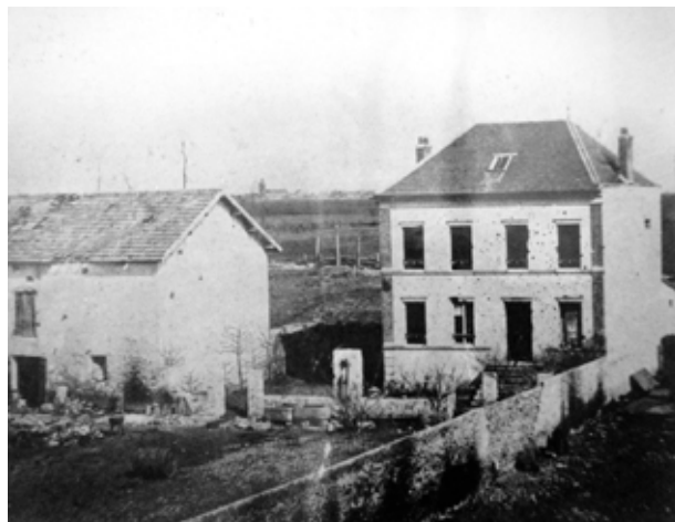
Photographie montrant l'état de la maison de la famille Cretté après le combat de Chevilly du 30 septembre 1870. L'église de Villejuif est visible au fond.

Dans divers livres relatant ces combats du 30 septembre 1870, les auteurs