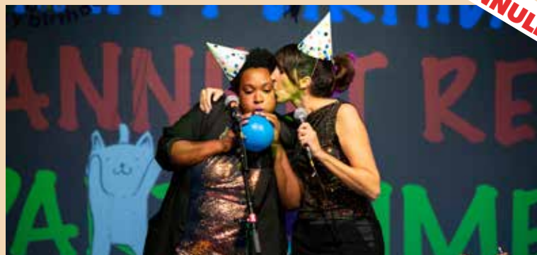
Elle/Ulysse, le récit de deux odyssees personnelles.

ELLES SONT AMIES depuis vingt ans, depuis qu'elles se sont rencontrées dans une troupe de théâtre. En 2017, elles ont chacune vécu un événement tragique qui a fait basculer leur vie le jour de leur anniversaire. L'une est tombée dans le coma suite à un accident de la circulation, l'autre a assisté