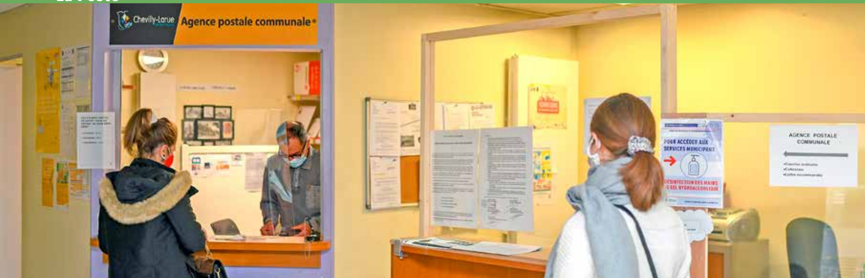
L'agence postale communale, un vrai service de proximité pour les riverains.

Installée dans les locaux du relais-mairie Larue boulevard Mermoz, l'agence postale communale rend bien des services aux habitants du quartier. Le Conseil municipal vient d'adopter le renouvellement de la convention qui lie la commune à La Poste.