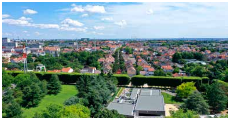
Le PLU (ou PLUI à l'échelle intercommunale) définit les règles d'urbanisme du territoire.

SI L'ARRIVÉE de la ligne 14 apportera en 2024 une opportunité de développement de l'offre de transport, elle génèrera également une pression immobilière qui se fait déjà sentir. Pour pallier ces effets pervers (risque de densification de la ville par des promoteurs privés, hausse des prix de l'immobilier, etc), le Conseil municipal a pris la décision de réviser son Plan local d'urbanisme (PLU), l'actuel n'étant plus adapté aux futurs enjeux urbains. La Municipalité pourra ainsi s'appuyer sur ce nouveau document réglementaire