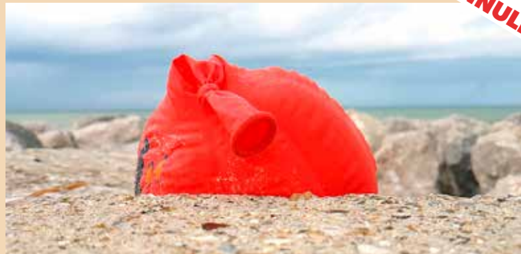
Et si on regardait les couleurs du monde en train de basculer...

ON REPRENDRA DES COULEURS, un titre d'exposition en forme de pensée magique en plein milieu de la crise sanitaire que nous vivons. Face à la peur que peut engendrer le basculement ou le tournant d'une civilisation, les cinq artistes de cette exposition collective plantent des œuvres comme autant de petits cailloux en nous proposant des repères