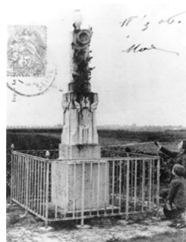
Le monument à la mémoire des militaires du 35 e régiment érigé le 27 août 1872 voie de Vitry (actuelle rue Paul Hochart, côté L'Haÿ-les-Roses).

critiquent la façon dont l'opération fut engagée et conduite, estimant qu'elle ne pouvait aboutir qu'à un échec, avec notamment des forces insuffisantes pour un objectif trop large avec des villages fortifiés. Cette opération manquée a au moins montré à l'ennemi la vaillance et la valeur de l'armée défendant Paris. Cela l'a incité à renforcer encore ses lignes de défense en prévision d'autres attaques et à faire durer le siège. Ainsi, la ferme de la Saussaye est dynamitée le 1 er octobre pour ne plus servir d'appui à une nouvelle attaque et une tranchée est creusée pour relier en sécurité Chevilly à L'Haÿ. La présence dissuasive de ses deux parcs fortifiés par l'ennemi fait que Chevilly n'est plus attaquée dès lors, contrairement à L'Haÿ, qui fait encore l'objet d'une vaine attaque le 29 novembre.